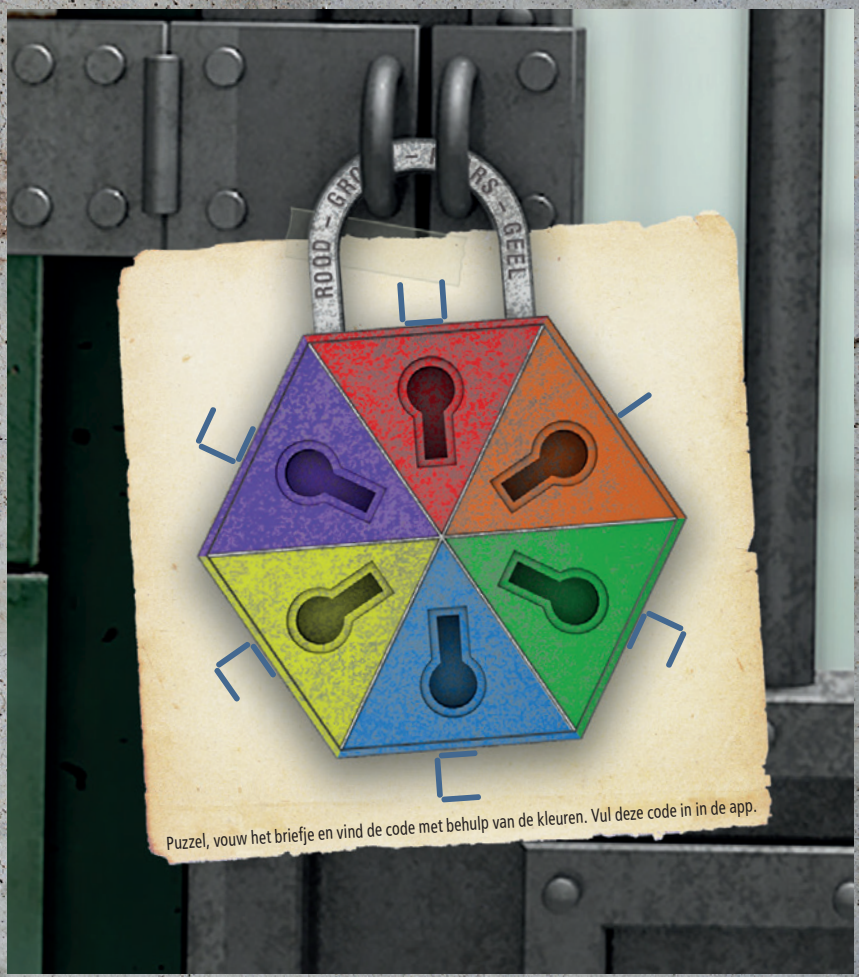
Puzzel, vouw het briefje en vind de code met behulp van de kleuren. Vul deze code in in de app.

HINTS: HINT 1 (05:00) UIT ELK VAN DE 5 PUZZELS IN DE CEL KOMT EEN VORM EN EEN VOLGORDE. DE VORMEN STAAN OOK OP HET BRIEFJE, VOUW DIT BRIEFJE ZODAT DE GEVONDEN VORMEN IN DE JUISTE VOLGORDE OP ELKAAR KOMEN. HINT 2 (10:00) 5 PUZZELS. 1 LEES DE WOORDEN ACHTERSTEVOREN. 2-BLAUWE BRIEFJE DOE DIT. 3-TAKEN OP DE GEVULDER. 4-ANAAWLOGO-OU-S-KUK OP VOOR. 5-ACHTERKANT VAN DE DEUR. HINT 3 (15:00) LEG ALS LAATSTE HET GEVONDEN BRIEFJE EXACT OVER HET SLOT. IN DE JUISTE ORIENTATIE. OM DE 4-CIJFERIGE CODE TE VINDEN. DE BENODIGDE KLEUREN STAAN OP HET HANGSLOT.